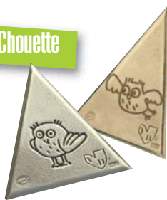
Porte clé, pins